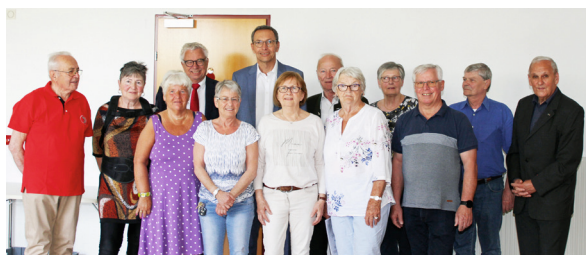
15 Jahre Mitgliedschaft