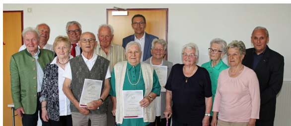
25 u. 30 Jahre Mitgliedschaft

Grillfest beim Sportplatz am Sonntag, den 14. August 2022 hinweisen. Kommen Sie zu uns, wir freuen uns auf Sie!