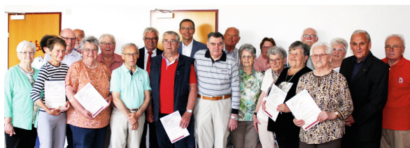
20 Jahre Mitgliedschaft

Der Pensionistenverband bietet ein vielfältiges Sport-, Kultur-, Bildungs-, Tanz-, Musik-, Ausflugs- und Vortragsprogramm an. Es wird Rat, Hilfe und Beratung in Pensionsfragen, bei Gebührenbefreiungen, zu Fragen des Pflegegeldes, bei Steuer-, Rechts- und Testamentsangelegenheiten geboten. Dieses Programm konnte auch in der Pandemiezeit unter Einhaltung aller Auflagen weitgehend aufrecht erhalten werden. Aktuelle Informationen zum Angebot an Informationsnachmittagen, Wanderungen, Radausfahrten, Stockschießen, Kegeln, Seniorengymnastik, Nordic-Walking, Tanzen, Spielenachmittag, EDV- und Handyunterstützung sowie zahlreiche Berichte mit Fotos von unseren Aktivitäten findet man im Internet auf schluesslberg.spooe.at auf der Seite der Pensionisten.